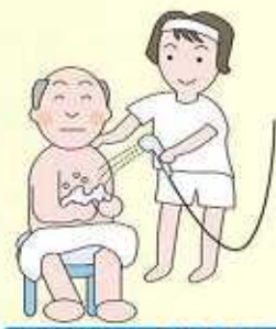
体を拭いたり、入浴介助など