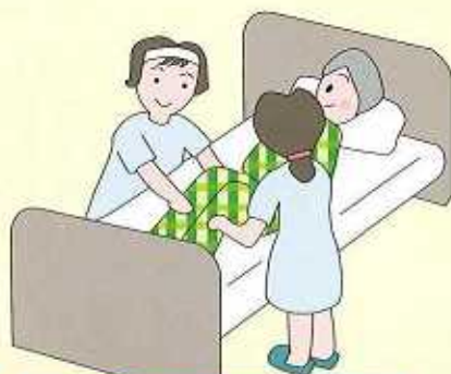
オムツのあて方やトイレへの移動など