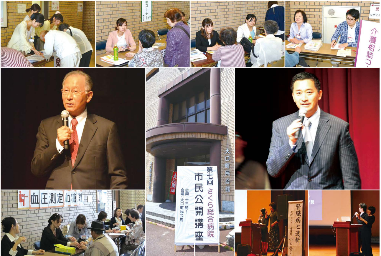
「第7回 さくら総合病院 市民公開講座」