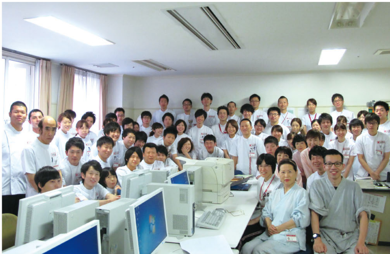
「総合リハビリテーション科」