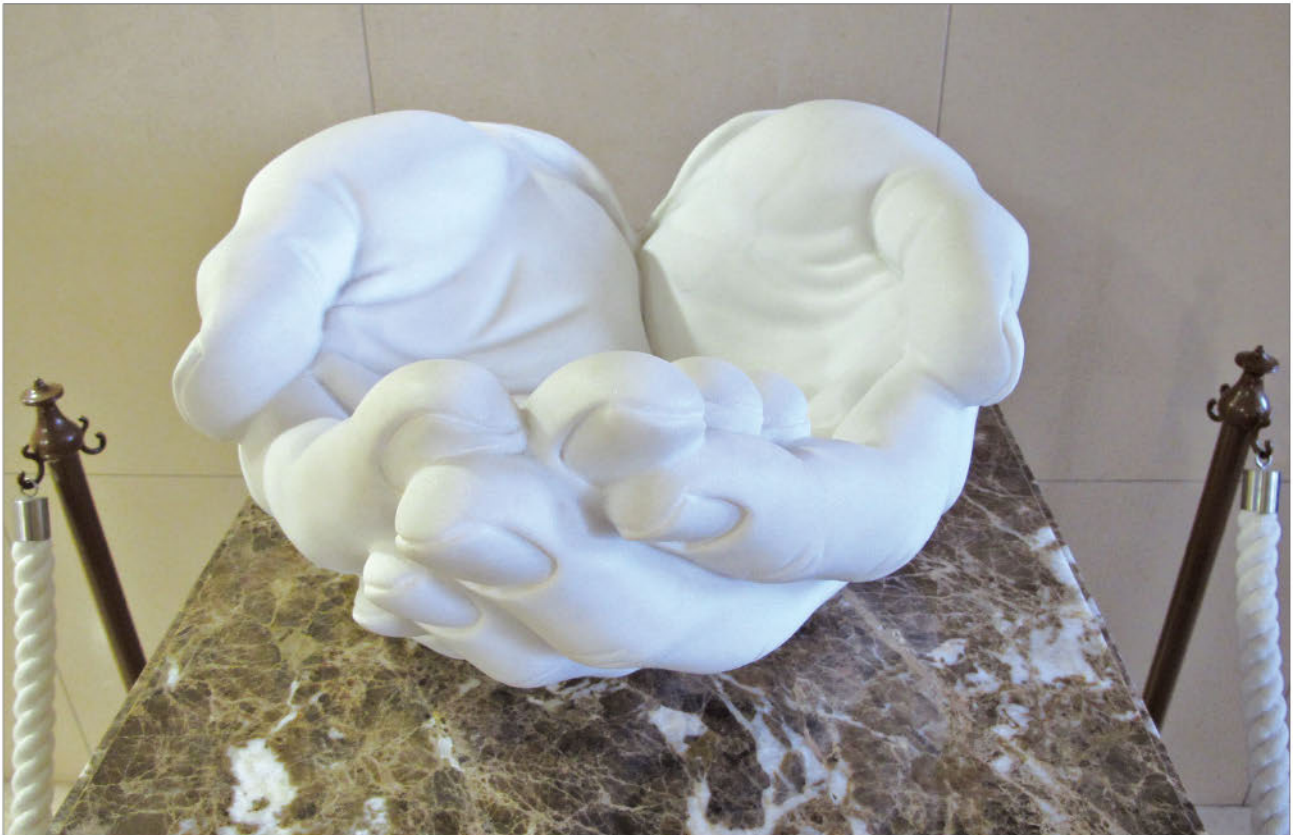
「ファティマ手」コンドル館 2F