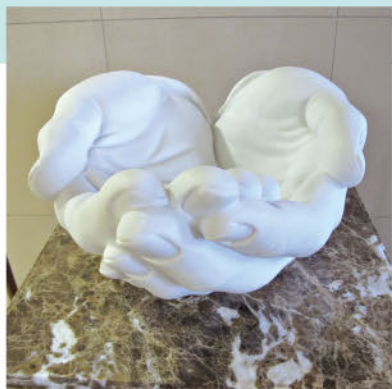
表紙の写真 ● 「ファティマ手」コンドル館 2F

高齢の方、障害のある方にとってリハビリはとても辛いことだと思います。それを前向きに、幸せなゴールに向かえるように一緒に考えて頑張っていきたいと思っています。