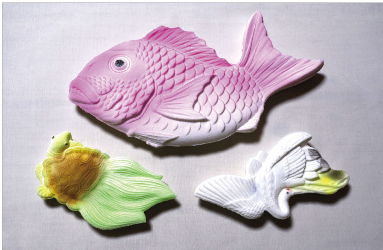
「落雁(らくがん): 鯛・鶴・亀」