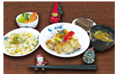
◆ クリスマスランチ ◆

※イベント食は療養病棟の患者さんを対象としており、別途料金をいただいております。