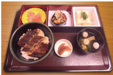
◆ うな井 ◆