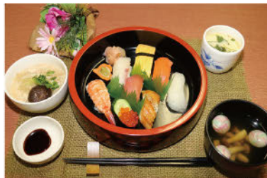
◆ お寿司定食 ◆