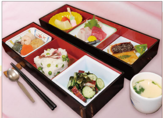
*献立内容・金額は一部変更になることがあります。ご了承ください。