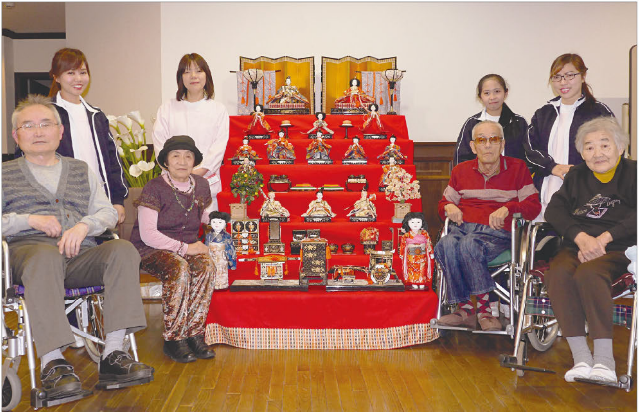
「さくら荘 ひな祭り」