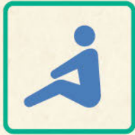
柔軟性 [長座体前屈]

体力測定は、自分の体力や筋力・活動量を知ることによって現在の健康状況や生活習慣を振り返るきっかけとし、自分に合った運動習慣を身につけること、また日常生活の中で意識して動くことにより、早い段階から生活習慣病を予防することができます。