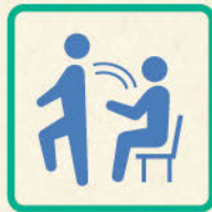
下肢の筋力 [椅子立ち上がり]