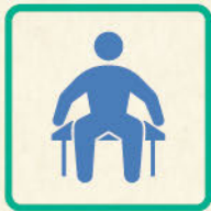
敏捷性 [ステッピング]