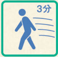
全身持久力 [3分間歩行]