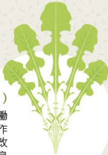
ホトケノザ(タビラコ)

タンパク質やミネラル他の栄養に富み、整腸効果・利尿作用・口臭を予防します。産後の浄血、催乳、歯痛に効果があります。