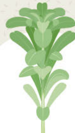
ゴギョウ(ハハコグサ)

カルシウムやカロテンが豊富で、高血圧予防や抗菌・解熱・利尿作用、風邪の予防に優れています。