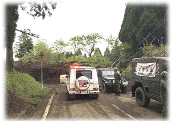
当院では熊本地震に対する医療支援活動としてSMATチームを派遣し、ドクターカー2台にて熊本県の南阿蘇に出動いたしました。