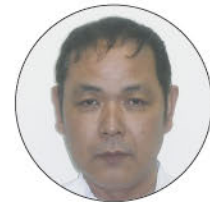
福祉センター 看護副部長