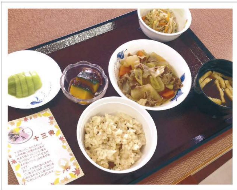
栄養管理センターでは、糖尿病、脂質異常症、胃切除を受けた方などの栄養指導、【外来・入院】食に対して不安を感じている患者さんに対する栄養相談を随時行なっています。お気軽にご相談ください。〔D棟2階 栄養管理センター〕

きのこご飯、牛肉と大根の旨煮、もやしとしそ和え、南瓜のいとこ煮、味噌汁、キウイフルーツ