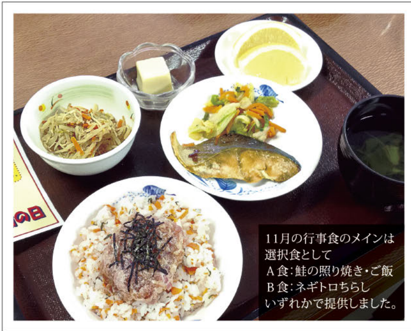
11月の行事食のメインは 選択食として A食：鮭の照り焼き・ご飯 B食：ネギトロちらし いずれかで提供しました。

本書では、福辺流介助術をもとにした、寝返り・立ち上がり・歩行・車イスと移乗・排泄などの介助方法を紹介しています。手順を追ってイラストで説明しているので動作の流れがわかりやすく、各介助のポイントや注意点、声かけの例も掲載。介護施設やご家庭など、さまざまな場面でお役立てください。